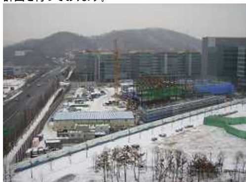
全体現況写真(12月30日南側より撮影)

発行者 株式会社フジタ ソウル支店 ソウル日本人学校作業所 ソウル特別市 麻浦区 上岩洞 A1-2 Tel. 02-306-7173 Fax.02-306-1900 URL: http://www.fujita.co.jp/