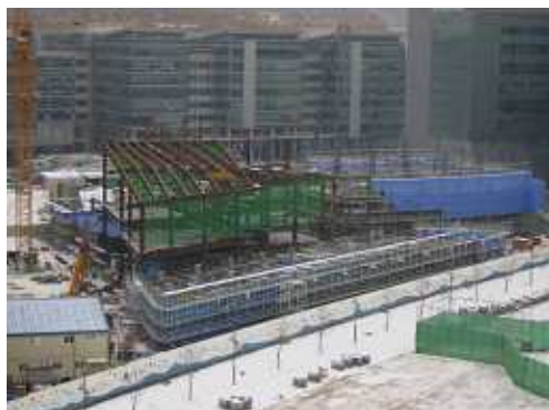
校舎部分現況写真(12月30日南側より撮影)